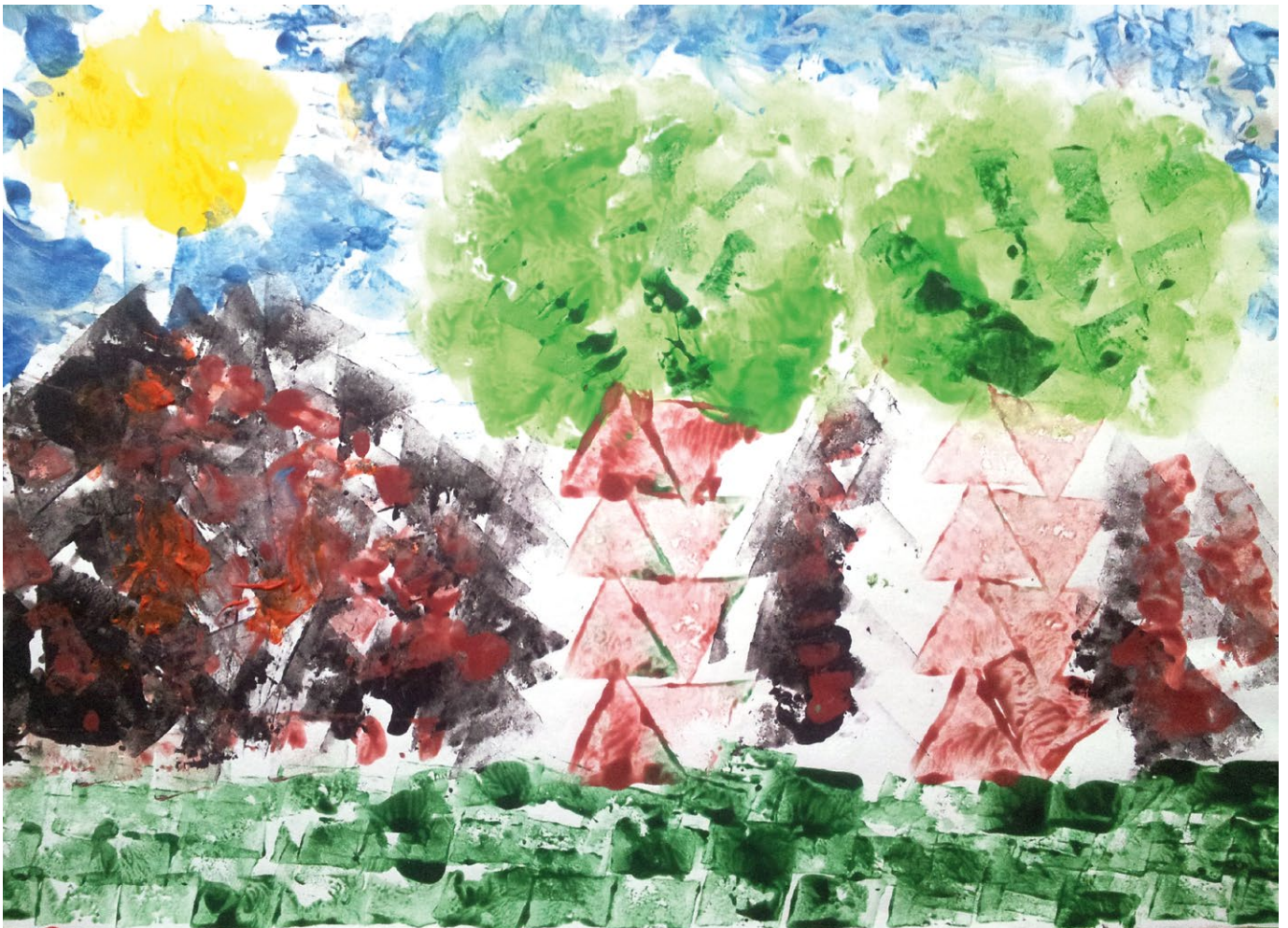
Malowanie stemplami z ziemiaka